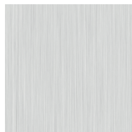
Aluminium silber eloxiert